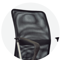
Espaldar en Malla